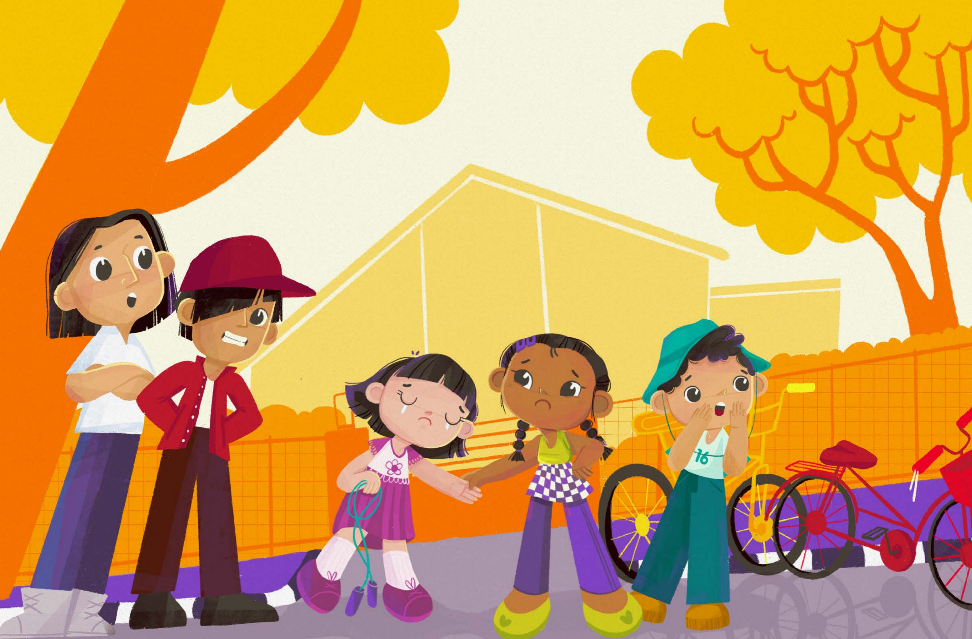
Sita menarik tangan Tiara dan mengajaknya pergi.